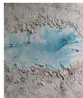
La plénitude Toile acrylique 80x80 cm