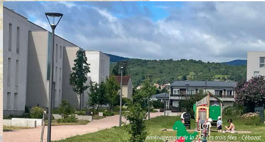
Aménagement de la ZAC Les trois fées - Cébazat

Concevoir des espaces de vie attractifs, inclusifs et résilients, en cohérence avec les politiques locales d'urbanisme et d'habitat.