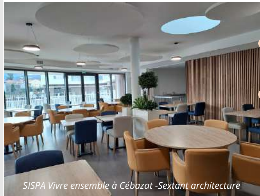
SISPA Vivre ensemble à Cébazat -Sextant architecture