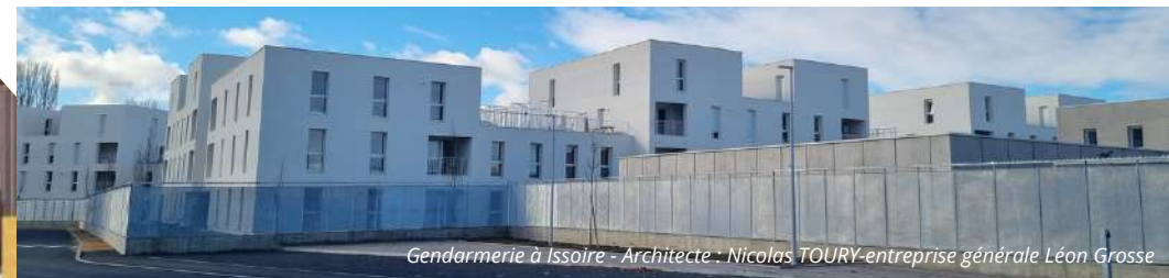
Gendarmerie à Issoire - Architecte - Nicolas TOURY-entreprise générale Léon Grosse

L'OPHIS contribue à offrir un service public de sécurité moderne et fonctionnel grâce à la construction et à la rénovation de casernes* adaptées aux besoins des gendarmes et de leurs familles.