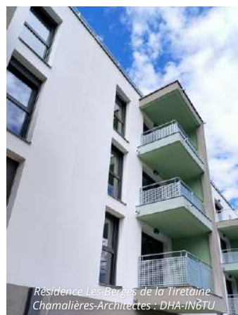
Résidence Les Berges de la Tiretaine Chamalières-Architectes : DHA-IN6TU