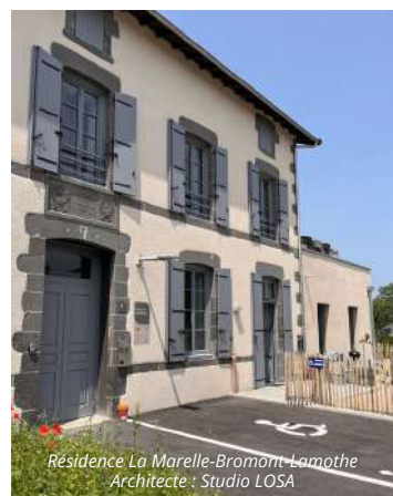
Résidence La Marelle-Bromont-Lamothe Architecte : Studio LOSA