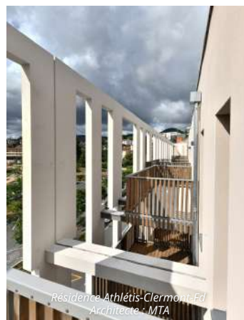
Résidence Athlétis-Clermont-Fd Architecte : MTA